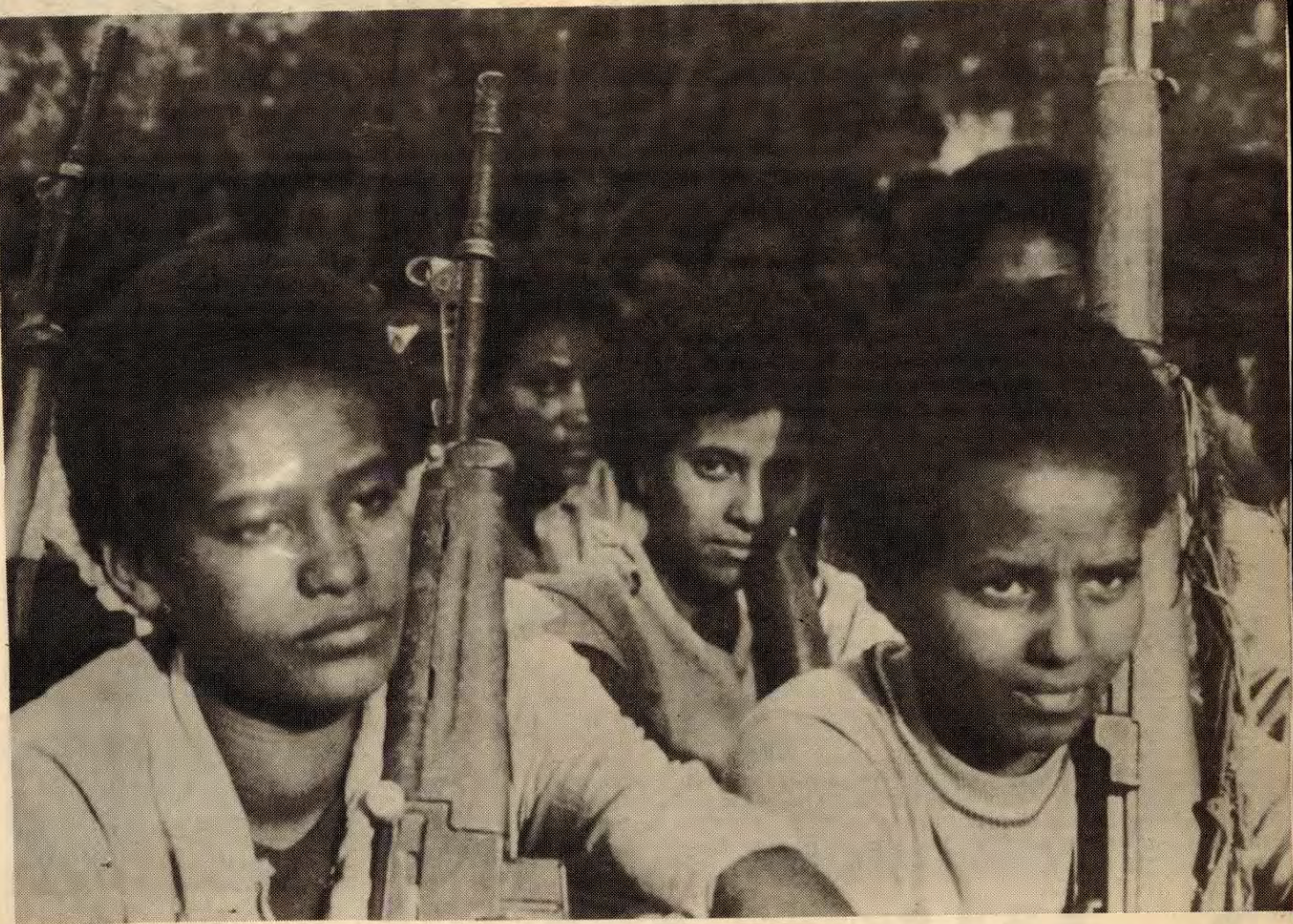
Frigjeringsrørslene kontrollerer no mesteparten av landet. Berre hovudstaden Asmara og to andre byar står igjen.

I 16 år har det eritreiske folket kjempa med våpen i hand mot dei etiopiske okkupantane og deira støtte-spearar. Den siste tida har frigjeringsrørslene vunne store sigrar. I dag kontrollerer fienden berre hovudstaden og to andre byar. Og frigjeringsrørslene arbeider for einskap seg i mellom. Det eritreiske folket kjempar ein rettferdig kamp og mot den står den etiopiske fascist-juntaen og sosial-imperialismen makteslaus!