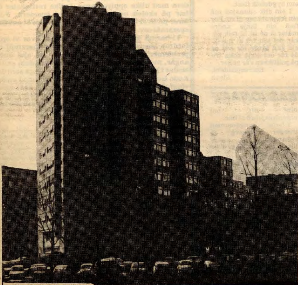
Yrkeskolenes Hybelhus i Oslo