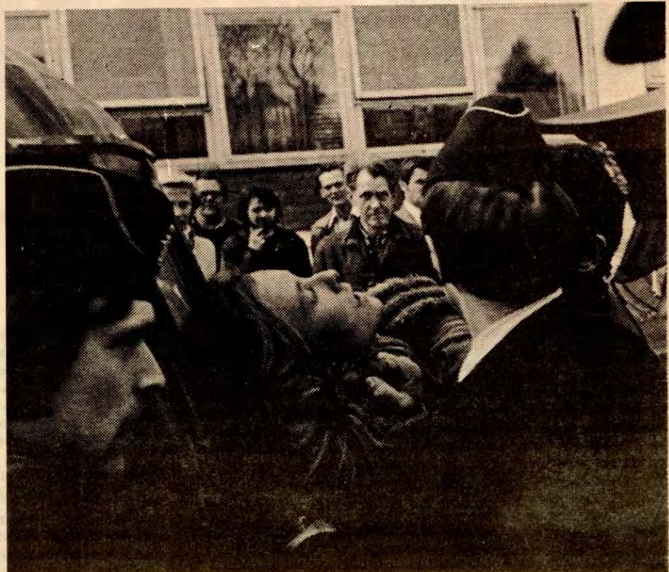
Lugging, sprak, strupetak og kvelertak er noen av politimetodene