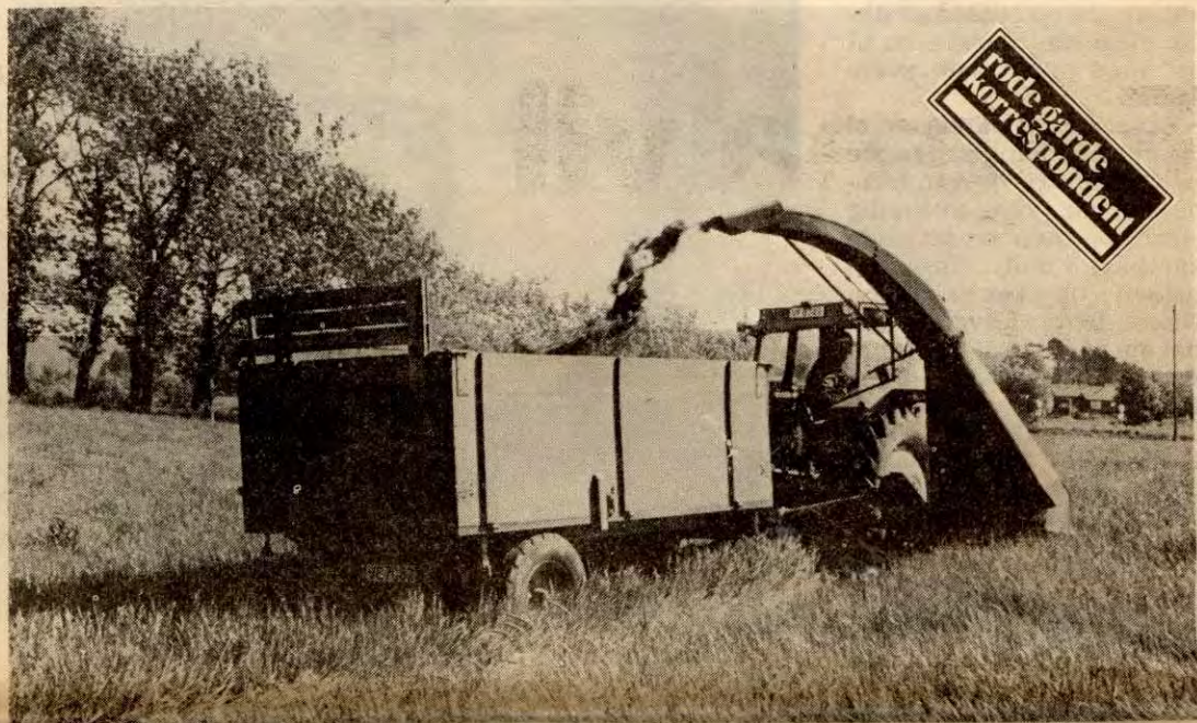
Landbruksopplæringa må tilfredsstille krava som stilles til en som har sitt arbeid i landbruket, mener ILFS.