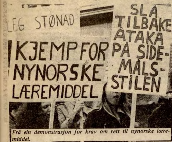
Frå ein demonstrasjon for krav om rett til nynorske læremiddel.