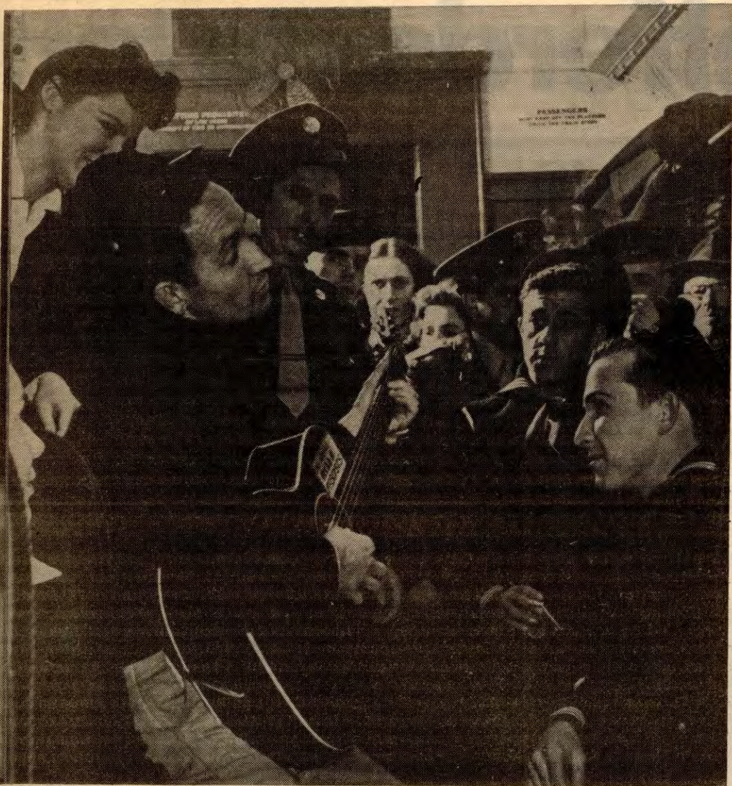
I forbindelse med 2. verdenskrig var Woody Guthrie glødende antifascist. Her spiller han på