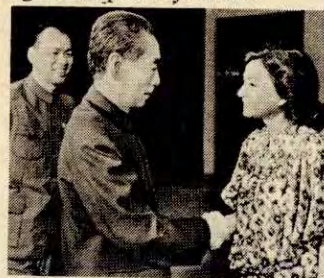
Chou En-lai hilser på en offisiell representant fra Iran.

fem prinsippene for fredelig sameksistens. Dette er ikke en ny politikk fra Kina, den er like gammel som Folkerepublikken Kina selv. Opprettelsen av diplomatiske forbindelser med en rekke nye stater skyldes ikke en ny politikk fra Kinas side, men skyldes at imperialismens og sosialimperialismens krefter er svekka og Kinas prestisje sterk.