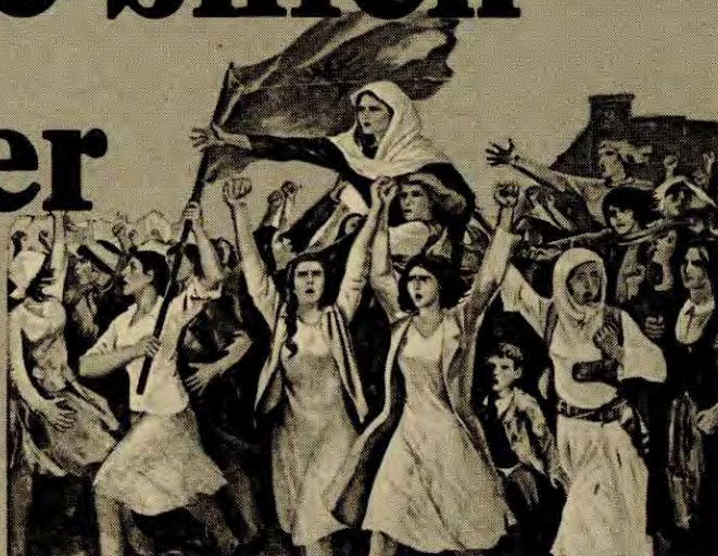
Fra et albansk maleri »September 1942»

utgangen på 1.verdenskrig? Jo, at verdens første sosialistiske stat oppsto, nemlig Sovjetunionen. Etter 2.verdenskrig var nesten 1/3 av menneskeheten frigjort fra imperialismen gjennom revolusjonen i Kina og Øst-Europa. Dette viser at krig ikke er uttrykk for styrke, men tvertimot for krampetrekninger i imperialismen, og at den vil