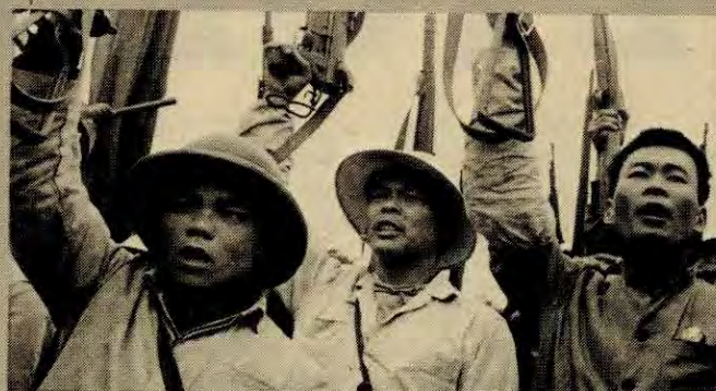
Kinesiske soldater demonstrerer mot russisk angrep