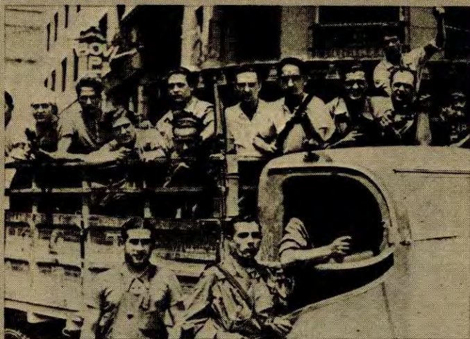
Den spanske borgerkrigen – et lysende eksempel på at arbeiderklassen og folket i et land får støtte fra folk verden over.

– Vi kommer ikke til å slåss aleine. Vi vil ikke ha noen imperialist som alliert, men en krig vil ikke ramme Norge aleine. Det vil bli svære kamper på alle fronter, frigjøringskamper vil bryte ut på nye steder. I tilfelle krig vil opposisjonen i supermaktene