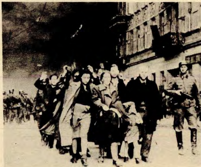
Arbeiderfamilie blir tatt av nazistene i Polen

Det norske militærapparat er et redskap for den norske herskerklasse, og monopolborgerskapet vil aldri stå sammen med folket i kampen mot angriperne. Det er folket sjøl som må kaste ut inntrengerne. Borgerskapet har intet fedreland, de vil støtte seg på den makt de tjener best på. Dette har historien vist oss.