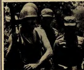
Cubanske soldater i Angola

Sosialimperialismen og revisjonismen verden over har svart på dette med nok en løgnkampanje mot Kina. Hva har så vært Kinas holdning?