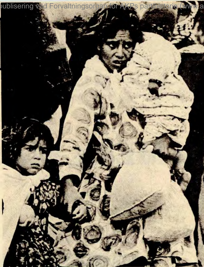
Palestinere på flukt