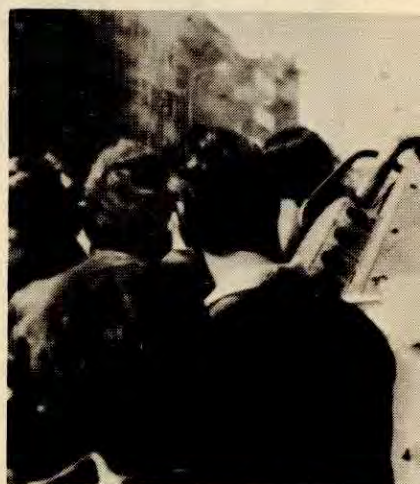
Folket i Tsjekkoslovakia protesterer

– 18. juni 1954 gjennomfører USA kupp i Guatemala. Kuppet har form som en direkte invasjon med amerikanske fly og flygere. Årsaken til kuppet var at myndighetene i Guatemala stod for