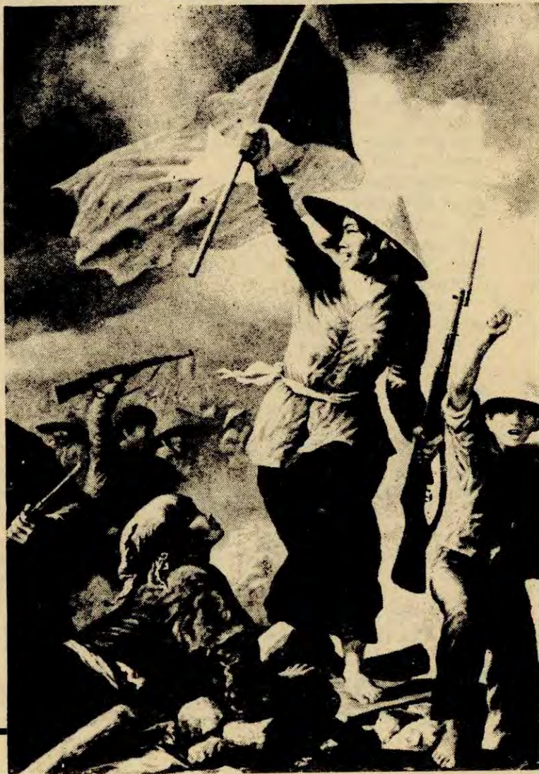
Utsnitt av maleri av Rolf Groven: «Friheten leder folket»

Rød Ungdom kjemper konsekvent mot all imperialisme. Vi protesterer når England driver rovdrift på fiskeressursene utafor Island og vi demonstrerer på gata til støtte for de arabiske folkenes kamp mot Israels imperialistiske aggresjon på deres landområder. Likevel legger vi hovedtyngden av vårt arbeid mot imperialismen i kampen mot de to supermaktene USA og Sovjet. Som den breie dokumentasjonen i dette nummeret viser er det disse to landa som utgjør hovedtrusselen mot verdens folk i dag. Det er bare USA og Sovjet som intrigerer i alle konflikter over hele kloden. Det er bare USA og Sovjet som har et spionnett som opererer i hele verden – USA med sitt CIA og Sovjet med sitt KGB. Det er de to supermaktene som kontrollerer hver sin aggressive militærpakt – USA er storebror i NATO, mens Sovjet har høvdingtittelen i Warzawapakta. USA og Sovjet kontrollerer hvert sitt våpenarsenal som er av en slik størrelse at de ikke kan sammenlignes med noen andre land. USA og Sovjet rivaliserer om verdensherredømmet og ruster opp i en takt verden aldri har sett maken til. USA og Sovjet forbereder verdenskrig – en krig retta mot arbeidsfolk i alle land.