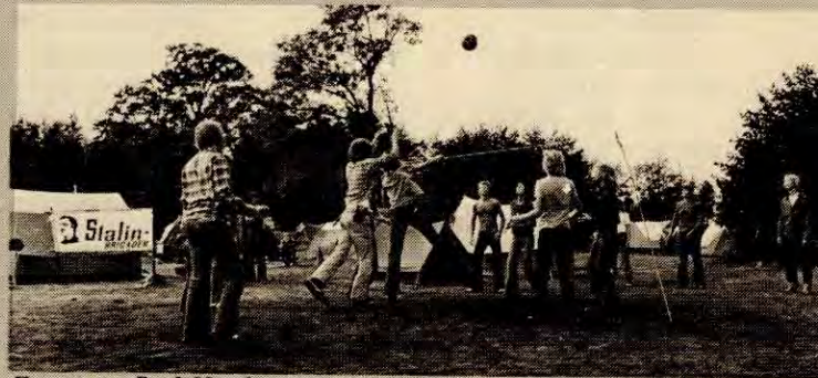
Fra en av Rød Ungdoms sommerleire

I sommer skal kampen mot krigsfaren opp som en av hoveddiskusjonene på alle leirene som ml-bevegelsen arrangerer. Vi oppfordrer alle som skal på leir til å studere dette intervjuet, og alle som ennå ikke har bestemt seg for å dra på leir til å bli med og diskutere denne viktige saka på Rød Ungdom-leir.