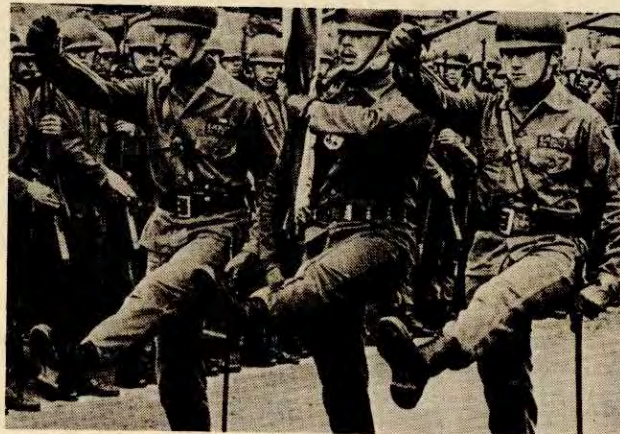
Chilejuntaen kan ikke boikottes ihjel.

En tredje påstand har vært at Kina støtter juntaen ved våpen. Igen en blank løgn. Dette ryktet ble satt ut av en