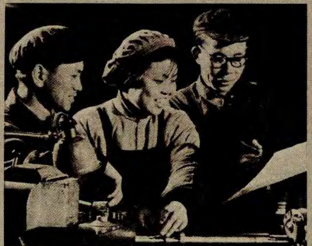
Arbeiderklassen har makta i Kina

– Hva mener du bør være oppgavene til den anti-imperialistiske ungdommen i kampen mot krigsfaren?