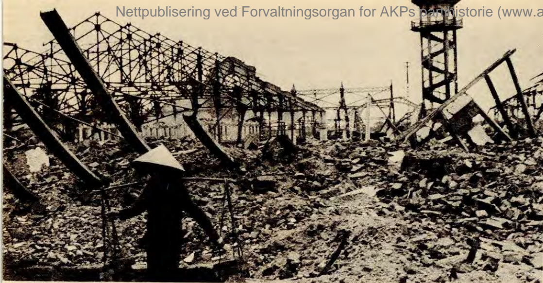
Fra gjenoppbygginga av Vietnam