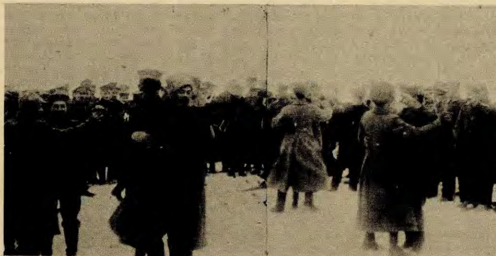
Forbrødring mellom tyske og russiske soldater. Den 1.verdenskrig var slutt, og revolusjonen seira i Sovjet, og fred blei slutta med Tyskland. De tyske soldatene tilkjennega sin støtte til arbeidermakta i Sovjet.

I alle imperialistiske krigar er drivkrafta til borgarskapet profitten. Dei krigar for profitt. I alle imperialistiske krigar nyttar borgarskapet soldatar frå arbeidarklassen som soldatar, utan omsyn til om dei dør. Tvertom brukar imperialistane soldatar som ein rein kjøttmur mot åtak frå fienden. Imperialistane vil alltid prate om »forsvar av fedrelandet» og liknande til folket og soldatane. Dette er bløff. Dei vil ikkje forsvare fedrelandet, men sin eigen profitt. Det er berre folket under si eiga leiing som verkeleg kan forsvare fedrelandet. Difor seier vi: Om imperialistane igjen vil starte krig, så skal vi vende våpna mot dei, frigjere landet og feie imperialistane ut med det same så vi ein gong for alle gjer slutt på krigen.