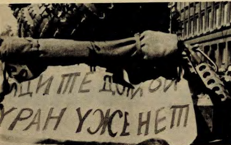
mot den sovjetiske okkupasjonen. «Reis hjem» står det på transparenten.