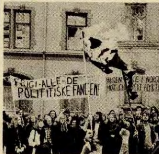
Solidaritetsdemonstrasjon for Chile

Forøvrig er det ikke usannsynlig at løgnkampanjen vil fortsette, og det vil bli viktig å avsløre den. Når Dagbladet sier at det kubanske telegrambyrået ikke gir »spesielt usannsynlige» opplysninger om Kina/Chile, så sier det mest om Dagbladet. Når Ny Tid gjengir offisielle sovjetiske telegrammer om Kina/Chile uten kommentar så sier det mest om Ny Tid. Nye forsøk på »dokumentasjon» vil sikkert komme, deriblant vil det helt sikkert finnes falske »noter» eller tall. Det er viktig å være offensiv og avsløre kildene til slike »dokumentasjoner» for dermed å avsløre løgnkampanjen som en løgnkampanje.