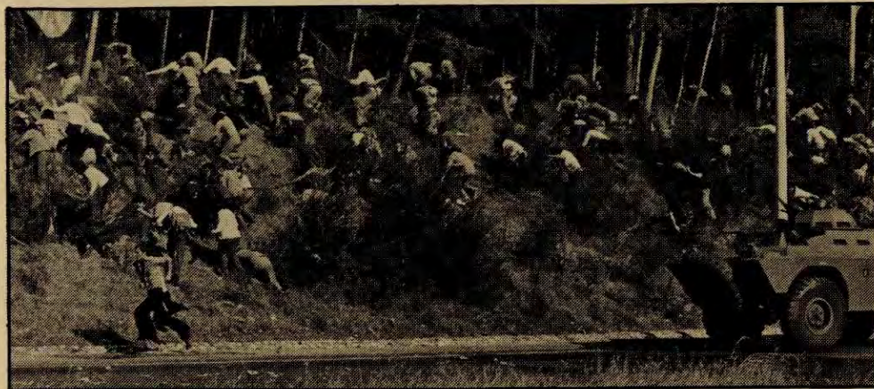
Det nye sikkerhetspolitiet, Copcon sine styrker forfølger demonstranter. Under ett av ofrene for Copcons kuiler.