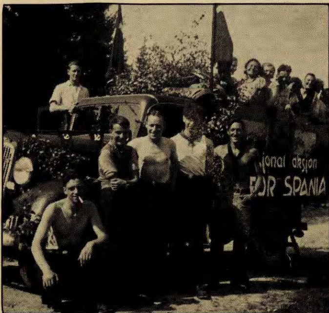
Fra en Spania-aksjon i 1937

Ei framand makt vil vere heilt avhengig av 5. kolonnistar. Det vil gjelde i ein ny krig og, dei vil ikkje klare seg utan. Me skaut jo nokre under krigen. Om me ikkje skaut dei, ville dei vere årsak til at mange andre vart skotne. Det var hardt, men det var ikkje anna å gjere. Eg hugsar ein som vart skoten på trikken i Bergen medan det var fullt av folk. Det var då trikken gjekk opp ein bakke. Han som skaut hoppa av då trikken gjekk opp. Ikkje før trikken hadde kome opp og han som skaut var sikker, vart det gitt beskjed slik at trikken stoppa. Folk sa ikkje noko for at 5. kolonnistar vart skotne. Det var jo krig.