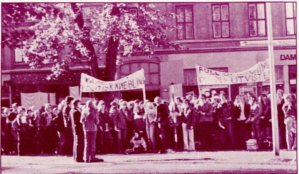
Demonstrasjon i Bergen til støtte for den utviste yrkesskoleeleven.

Lenin sier: »Politisk reaksjon over hele linjen er karakteristisk for imperialismen.» Vi ser dette nå som kapitalismen går inn i ei av sine økonomiske kriser. Suspendasjonene av progressive i fagbevegelsen, hets mot kommunister, bakvaskelser og