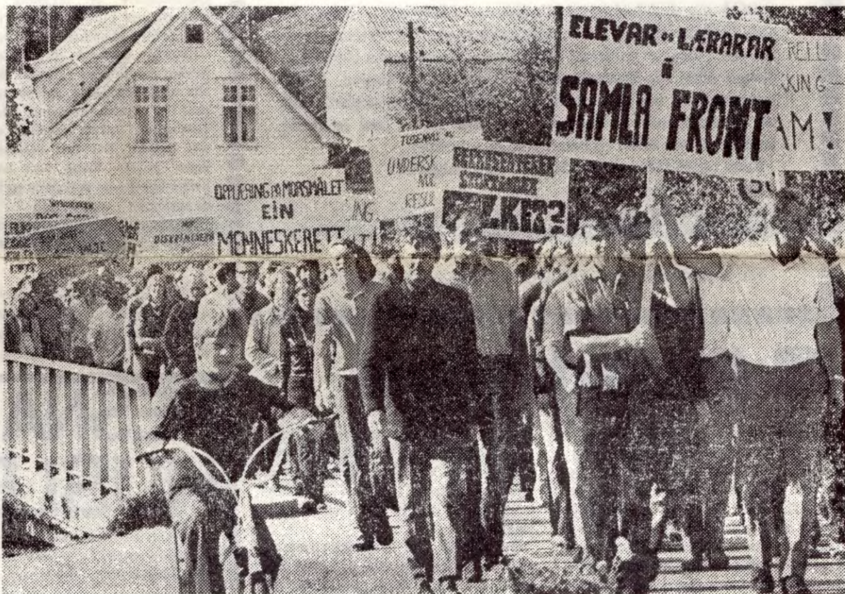
Lærere og elever i enhetlig kampfront mot statens lærebokpolitikk overfor de grupper som har nynorsk som morsmål.

Skolebøkene har stått i sentrum for kampen på skolene i høst. Øystese gymnas gikk i brodden for det rettmessige krav: å få bøker på nynorsk. Denne aksjonen sprer seg over hele Vestlandet. Det ble straks sympatiststreik på Voss og underskriftskampanjene viser overalt 100 % oppslutning. Elevene ved Ringve, Ski og Bjørkelangen reformgymnas har streiket for full kompensasjon for kjøp av lærebøker. Det er ikke bare nynorsk-elevne og elevene ved reformgymnasene som har problemer med lærebøkene. Elever ved alle gymnas må kjøpe skrivemateriell sjøl. Ofte må de kjøpe alle bøkene sjøl, iallfall oppgavesamlinger og øvelsesbøker. Skolebøker er veldig dyre. Hvorfor? Jo, fordi de private forlagenes profitt må holdes oppe selv om opplagene er små! At dette skaper økonomiske problemer for elevene og deres foreldre spiller mindre rolle! Vi marxist-leninister mener det er et rettmessig krav at alle gymnasiaster og yrkesskoleelever må ha full kompensasjon for kjøp av lærebøker. Vi oppnår ingenting hvis vi ikke kjemper. Derfor følg Øystese og Ringves eksempel: ta kampen opp på din skole.