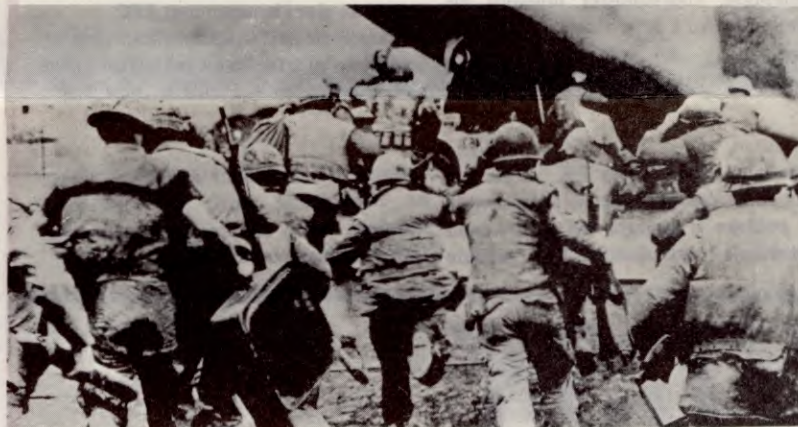
Mamma, vi vil hjem!