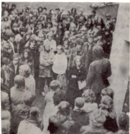
Fra streiken på Ringve i Trondheim.

Representantene la i Oslo opp en linje for videre aksjoner: Hvis svaret blir