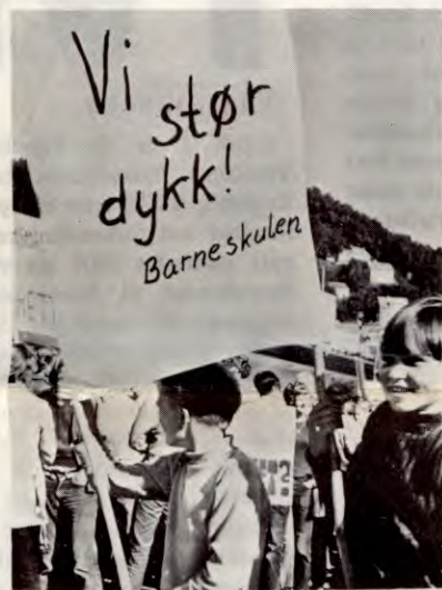
Barneskolen tok fri da gymnasiastene streiket for å kunne gi dem sin støtte i kampen.

Elevane ved Øystese realskule og gymnas har gått i brodden i kampen for fleire nynorske lærebøker i skulen. Dei vedtok på felles allmannamøte med lærarane å gå til ein ein-times streik i protest mot statens lærebokpolitikk.