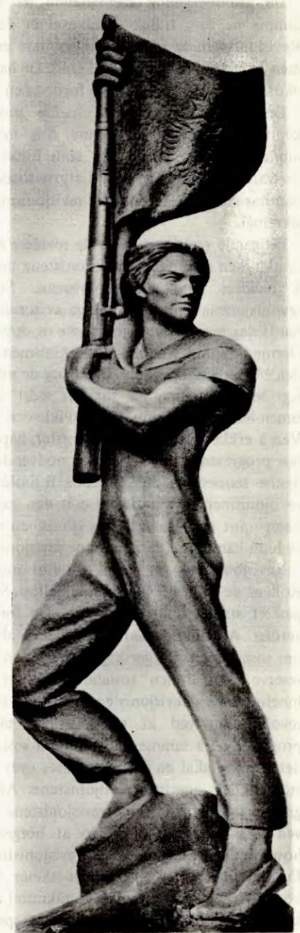
Styrk den revolusjonære gløden!

Dette er nettopp hva som hendte i Sovjetunionen. Klassekampen på det ideologiske området blei forsømt. Dette førte til degenerasjon innenfor partiet og statsapparatet. Det oppsto et byråkratisk skikt som skilte seg fra folket. Dermed kunne revisjonismen utvikle seg lettere. Da Krustsjov kom til makta satte man i gang arbeidet med å revidere marxismen i Sovjet og erstatte den med borgerlige teorier som passet de herskende byråkratenes formål. Slik blei det lagt til rette for omdanninga av hele