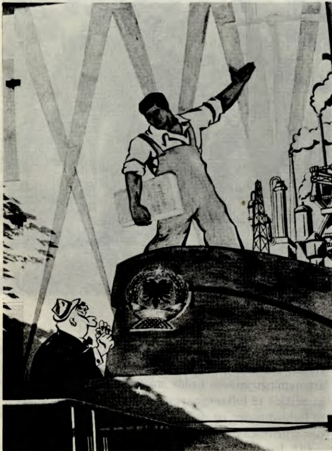
Den albanske arbeiderklassens framgang – en torn i øyet på imperialismen

denne måten prøvde Tito-klikken å gjøre de systematiske provokasjonene overfor det albanske folket om til uheldige utslag av enkeltindividens framferd. Men historia har seinere vist at myrderiene av albanere har fortsatt, og både høsten 1968 og 1969 kunne de store telegrambyråene igjen fortelle om massakrer utført av jugoslavisk politi, etter at albanerne på årsdagen for frigjøringa hadde deltatt i masseopptog og viftet med albanske flagg.