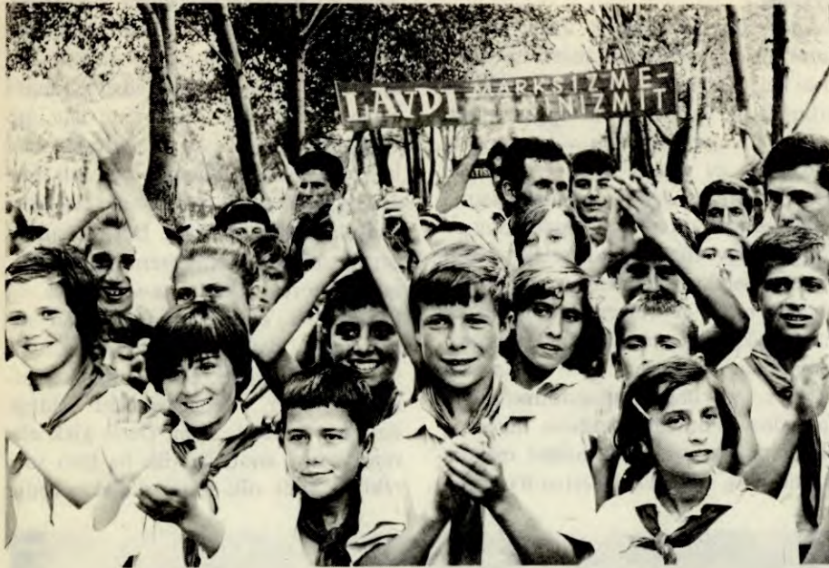
Leir for 1600 ungdommer i alderen 7-14 år, utenfor Dürres