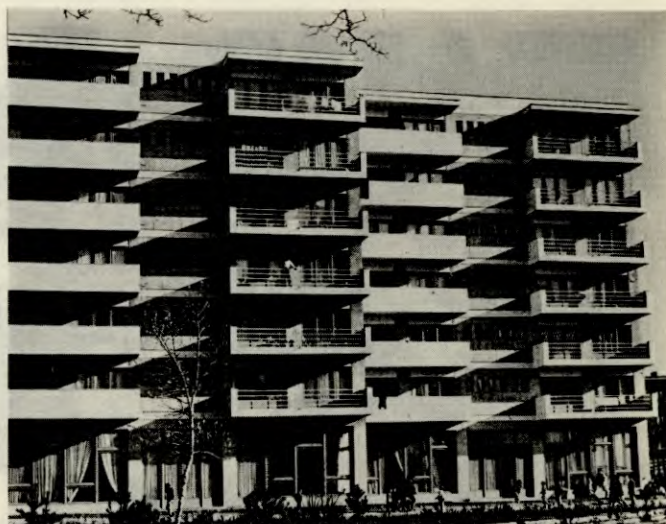
Nytt bolighus i Korca