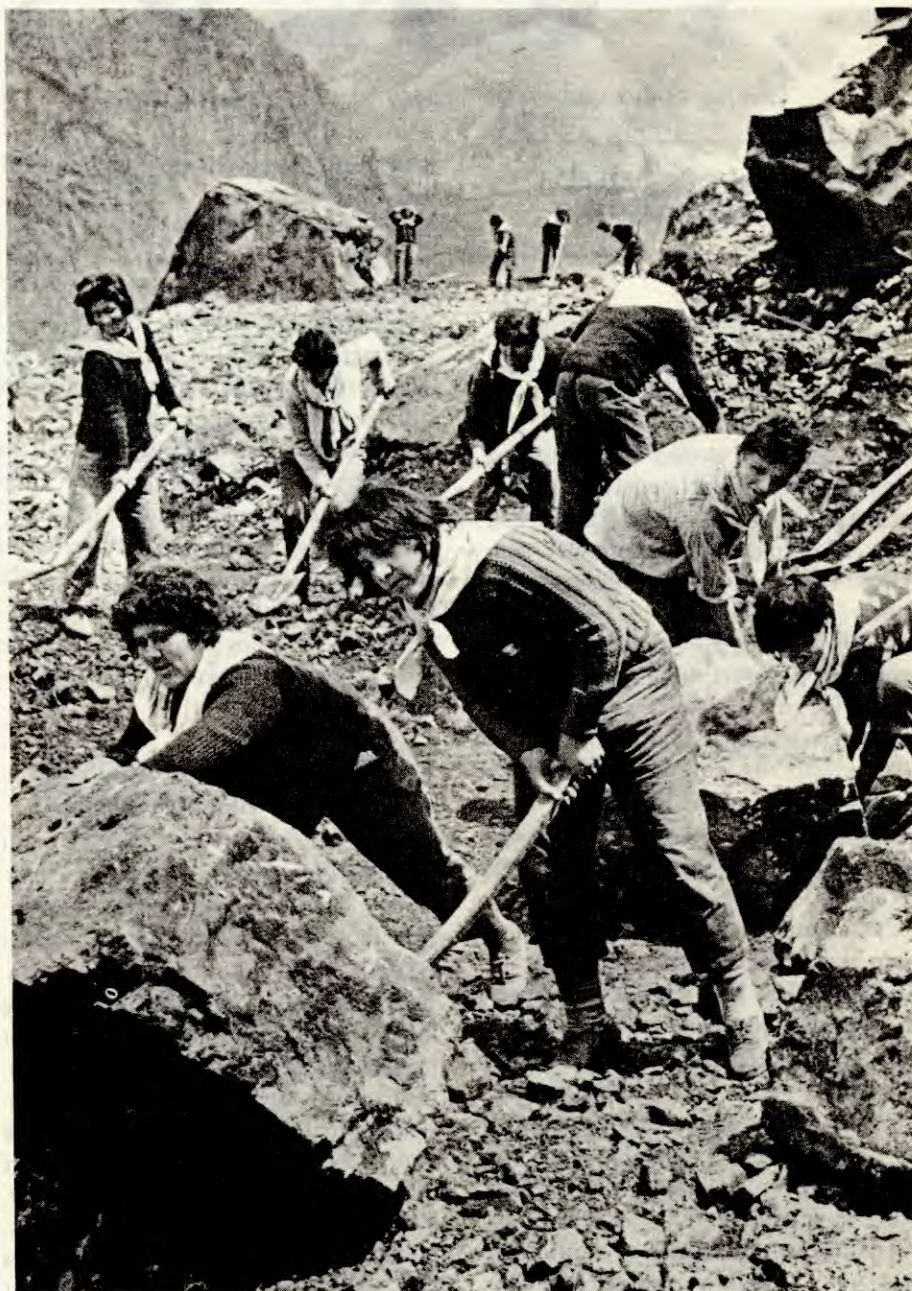
Frivillig ungdomsbrigade på veibygging

falsk autoritet, men en revolusjonær autoritet bygd på prinsippet om kritikk og selvkritikk. Også læreren må kunne innrømme sine feil og be elevene om hjelp til å forbedre seg. Ved et gymnas i Tirana for tre år siden, kom det opp veggaviser med kritikk av rektoren, som hadde opptrådt føydalt, og ved flere anledninger skjelt ut elevene, og ikke godtok kritikk fra dem. Det blei arrangert et møte mellom lærerne og elevene, men rektoren nektet å ta selvkritikk, og fortsatte å opptre som før. En tid seinere blei det holdt et nytt møte, hvor han tok selvkritikk på noen få uvesent- lige punkter. Departementet vedtok deretter å avsette ham. Dette gikk ele- vene sterkt imot, de ville ha ham som rektor, og de ville at han skulle forbedre