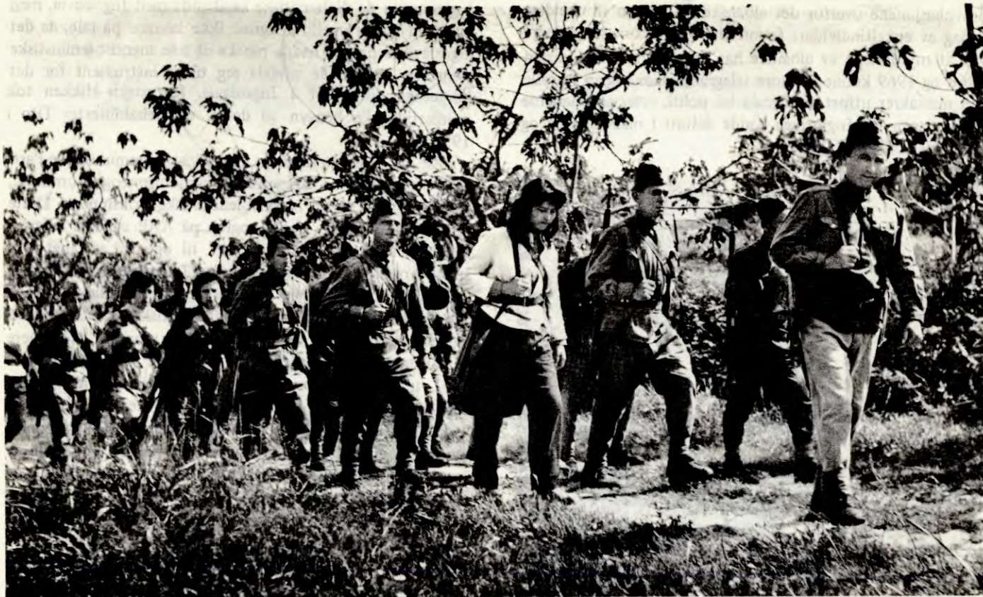
Hele folket tar del i forsvaret av landet

grensestrøk opp mot folkeregjeringa. Denne politikken har imidlertid ikke båret frukter.