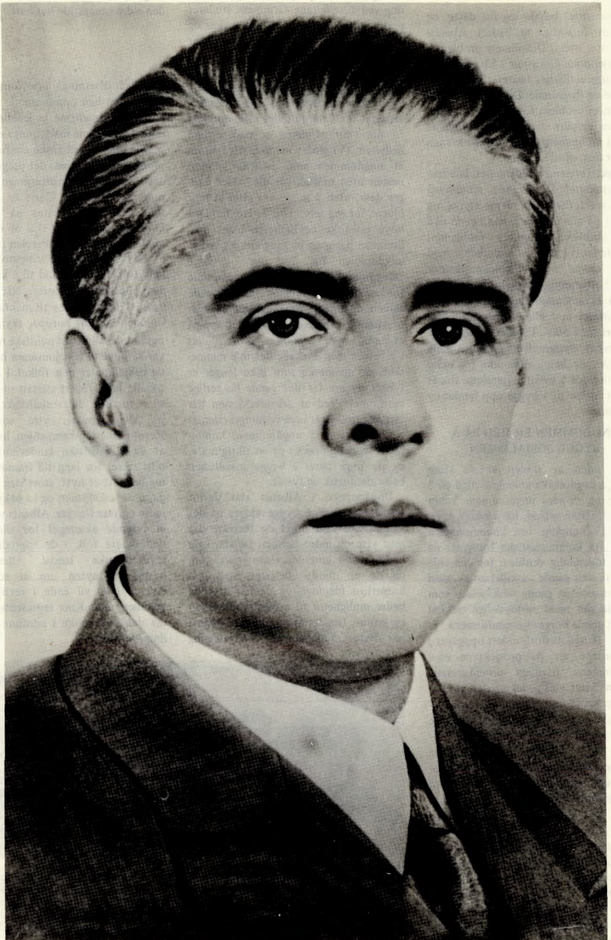
Enver Hoxha, formann i Arbeidets Parti i Albania.