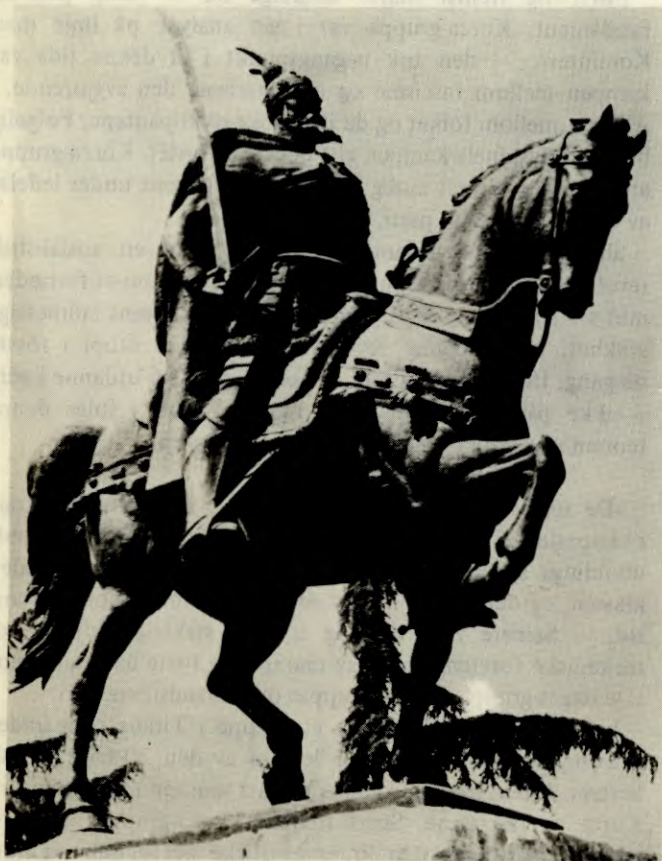
Gjerg Kastrioti Skanderbeg

Denne avtalen blei seinere offentliggjort av den nye sosialistiske Sovjetstaten, som fullt ut støtta det albanske folket i uavhengighetskampen. På denne måten blei imperialismens vesen avslørt overfor folket i Albania, og den anti-imperialistiske frigjøringsbevegelsen vokste. I 1920 reiste tusenvis av bønder seg til opprør i de deler av landet som nå var blitt okkupert av Italia, og imperialistene i Roma blei tvunget ut av Albania og måtte anerkjenne landet som egen stat.