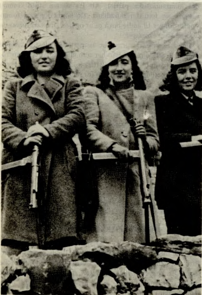
Kvinnelige soldater i Folkets Frigjøringshær

(Resolusjon fra kommunistgruppene samlingsmøte 8.–14. nov. 1941)