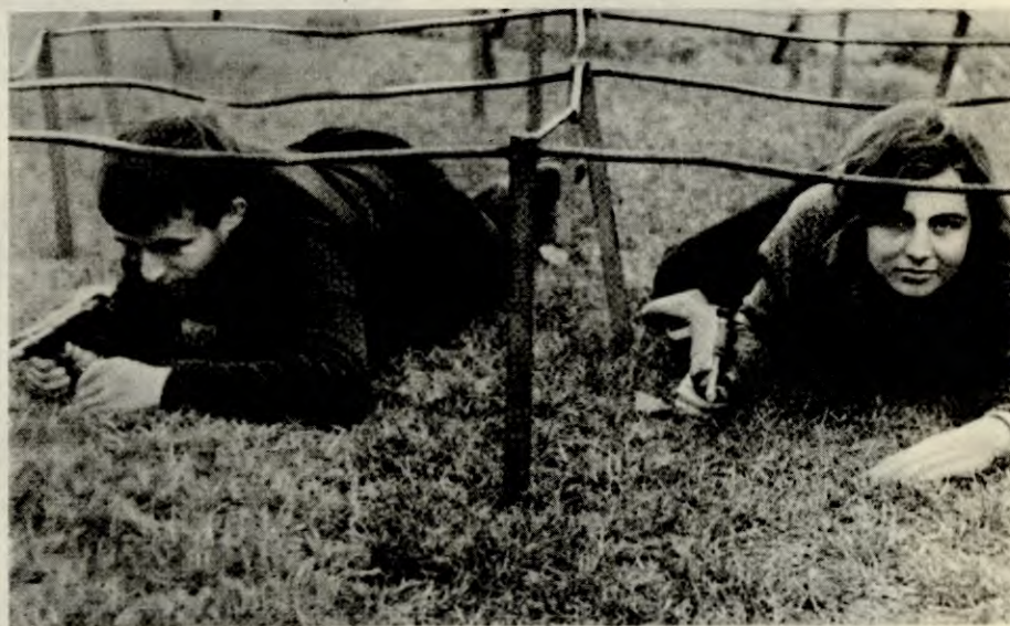
Fysisk og militær trening for ungdommen går hand i hand

Hovedmålsetninga i revolusjoneringskampanjen kan oppsummeres i parolen: »Arbeiderklassen må ta ledelsen på alle områder» . Denne målsetninga er det som preger hele det albanske samfunnet. Det preger produksjonen, det preger partiet, det preger administrasjonen og det preger utdanninga. Dette er en parole som ikke bare vedtas på en partikongress. For at den skal bli en realitet må hele folket delta. Parolen forutsetter et høyt allment skoleringsnivå, slik at hele folket blir i stand til å kontrollere den politikk som føres. Når revisjonismen kunne komme til makta i Sovjet-Unionen og Øst-Europa, skyldes dette også at det allmenne politiske nivået ikke var så høyt at revisjonismen blei avslørt og bekjempa av hele folket. I Albania er nå alle lag i folket stålsatt med en vilje til å forsvare det sosialistiske systemet på alle fronter, ytre som indre. Revolusjoneringskampanjen har ført til at de sosialistiske landevinningene er blitt sikret for lang tid framover. Albania har tatt et nytt, stort steg i oppbygginga av sosialismen og i å bekjempe alle indre og ytre fiender. Albania vil stå som et lysende eksempel for alle verdens underkuete folk i de kapitalistiske og revisjonistiske landa. Albania har motbevist myten om at sosialismen nødvendigvis vil ende i revisjonismen. Sammen med Kina representerer Albania den nye epoke i samfunnets utviklingsprosess.