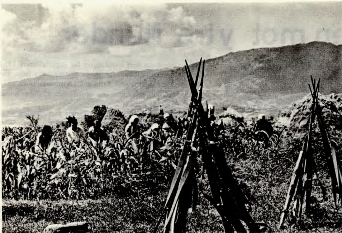
Væpna kollektivbønder på grensa mot Jugoslavia

jugoslaviske kommunistene. Disse agentene til Tito-klikken innafor sentralkomiteen i AKP klarte til og med å presse igjennom vedtak om at den albanske frigjøringskampen var en integrert del av kampen i hele Jugoslavia. Videre fikk de også vedtatt anti-marxistiske teser om at klassekampen var i ferd med å dø ut, og at borgerskapet ikke måtte styrtes, men kunne reformeres. På et tidspunkt foreslo også Tito-klikken full sammenslåing av de to lands frigjøringsarmeer under jugoslavisk toppleing. Men dette blei bestemt avvist.