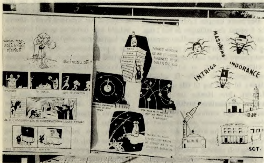
Plakater mot religiøse fordommer

Kampen for kvinnens likestilling henger nøye sammen med kampen mot den religiøse innflytelsen. Spesielt islams innflytelse har bidratt sterkt til å hemme frigjøringa av kvinnen. De gamle religiøse fordommene får kvinnen til utelukkende å se sin oppgave som mannens tjener i hjemmet, og de hindrer henne i å gå inn i produksjonen og å delta aktivt i de politiske organisasjoner. Uten en intens kamp for kvinnens frigjøring ville halve folket fortsette å være underkuet av gamle regler og påbud. Videre utgjør