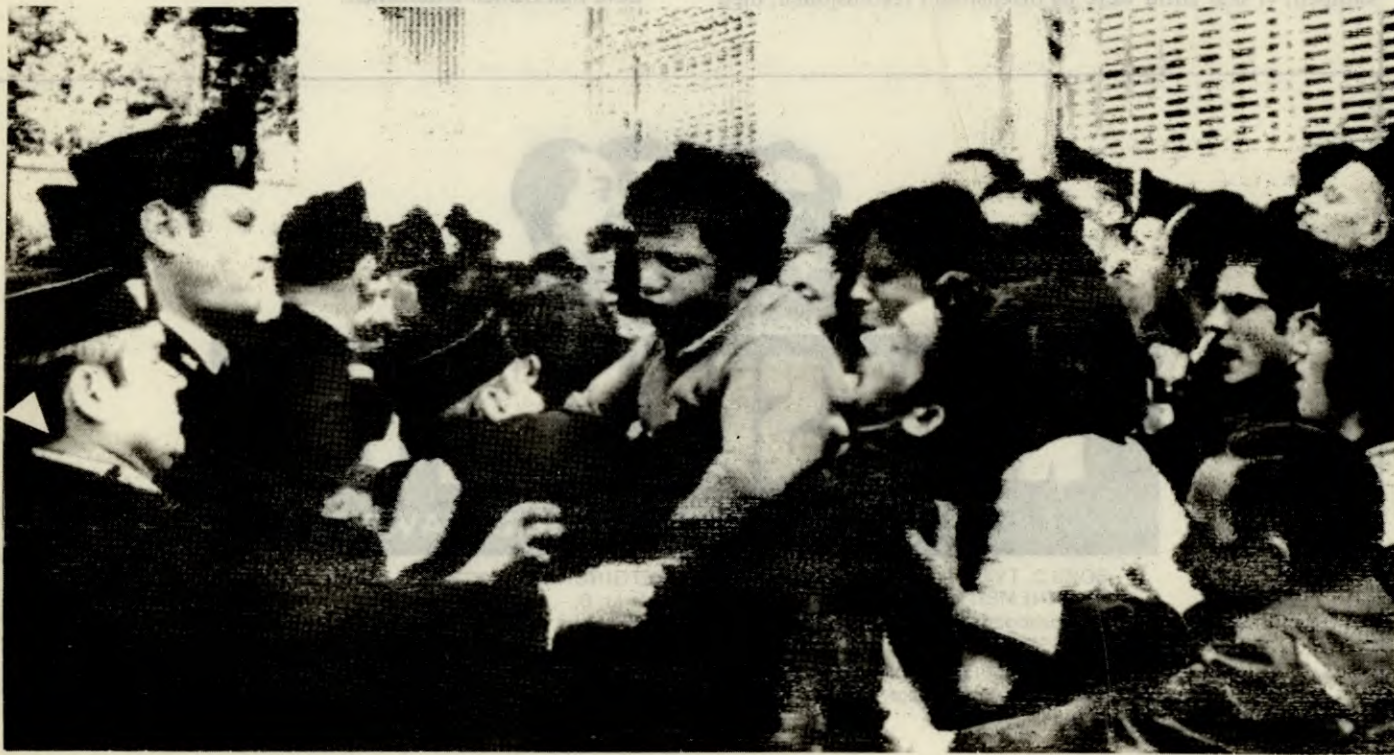
Franske arbeidere og studenter i kamp med politiet den 10. juni 1968.

Klare linjer for den proletariske revolusjonen må dras opp