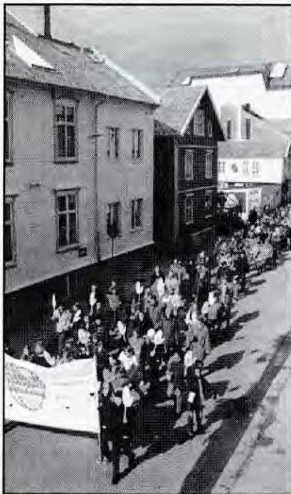
350 i demonstrasjon i Haugesund