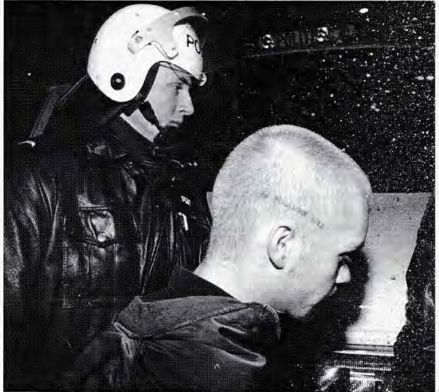
Jødehater og nazist er nok et bedre ord, enn "innvandringsmotstander" på denne unge mannen. Tatoveringen "6 million lies" taler for seg.