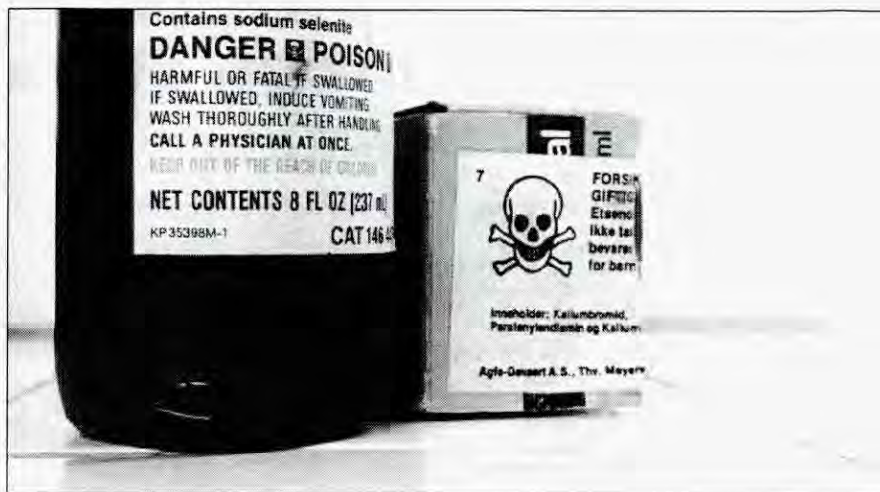
Borgerskapets gift Foto:Sigurd.

Hva dette vil si har regjeringa vist ganske tydelig i sin iver etter å sende tilbake