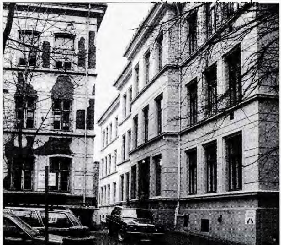
Møllergata skole i Oslo, forsøkt lagt ned flere ganger uten hell.

Fortsatt slåss de i Bergen for å få omgjort vedtaket, men det er lite som tyder på at de vil lykkes. Dette er bare nok et bevis på at det finnes en lov for de med