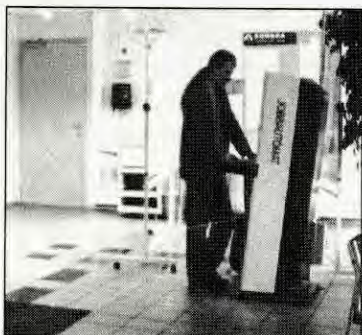
Hvor går velferdsstaten?