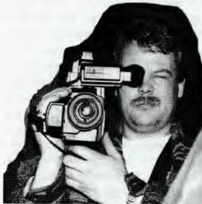
Over: Politet i full gang med å fotografere antifascister i Oslo på anti-nazi-demonstrasjonen 21.3.95.