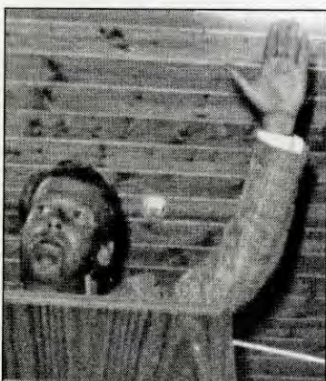
Fremskrittspartiet, to skritt tilbake og ett til høyre?