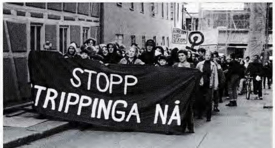
Demonstrasjonen på vei mot Blaze, 1. april.