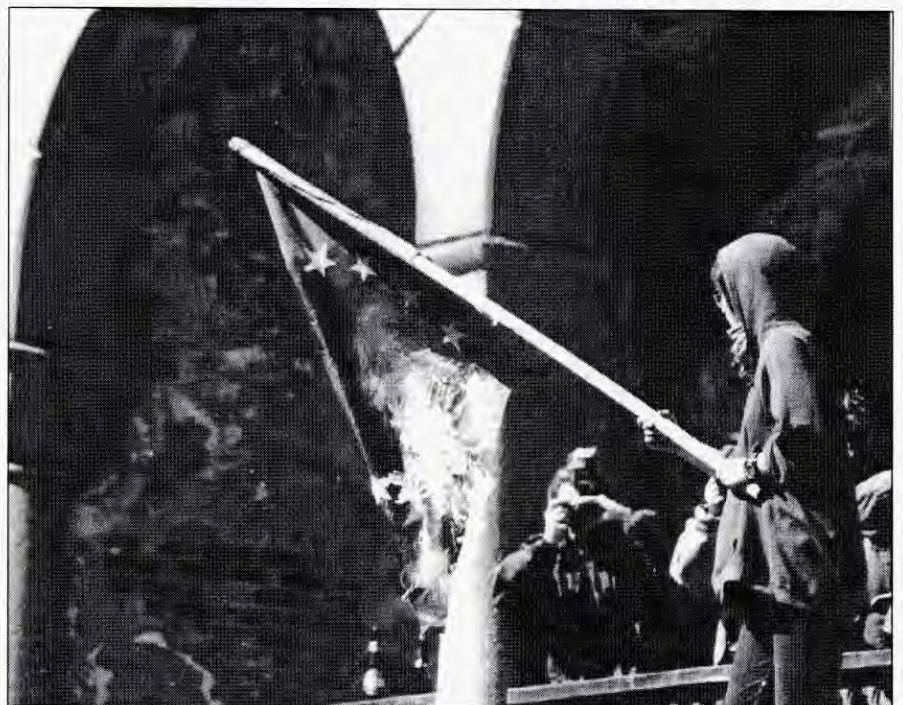
Ein kan vise EU-motstand på fleire vis.

Imperialistane får hjelp av eit skitt av byråkratar, politikarar og teknokratar som utgjer ei femte-kolonne innafor Noregs grenser. Folk i DNA, departementa, Telenor, Konkurransetilsynet og mange andre stader spreider kvar dag propaganda for at “internasjonalisering” er unngåeleg, og at EUs politikk er einaste moglege politikk. Desse folk lyder instinktivt direktiv frå Bryssel, sjølv om me ikkje er med i Unionen. Dei set til sides Stortinget si mening, dersom det norske demokratiet kræsjar med det EU-ske teknokratiet.