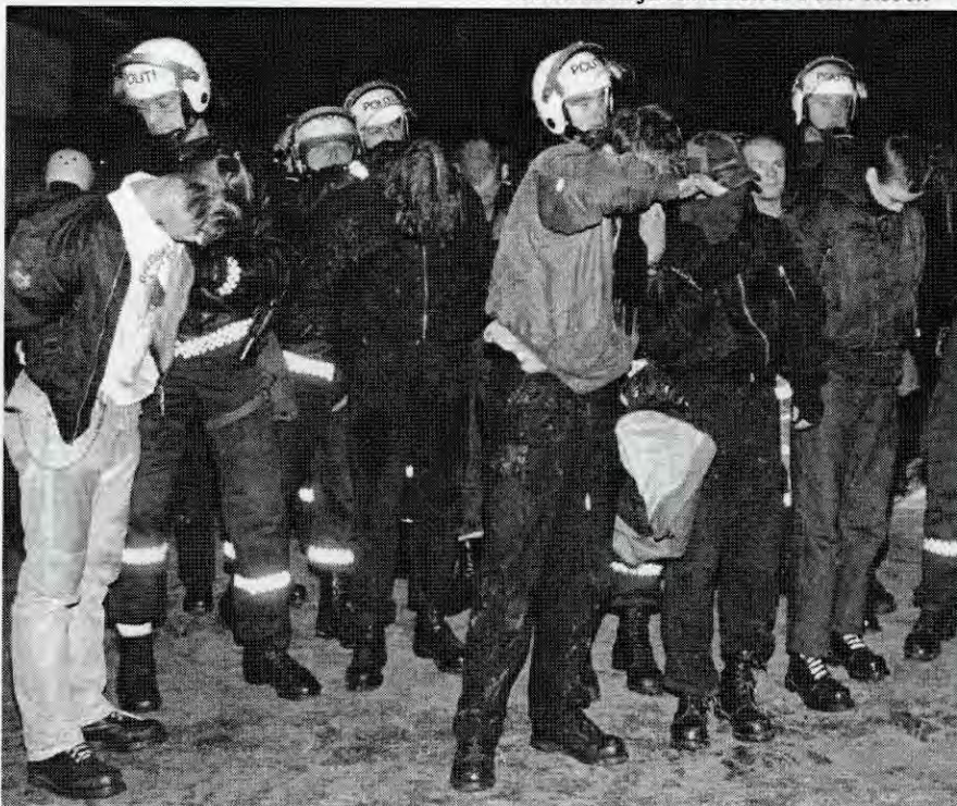
Nazister som blir arrestert på Aker "kultur"verksted.