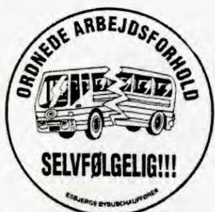
Knallhard klassekamp i Danmark