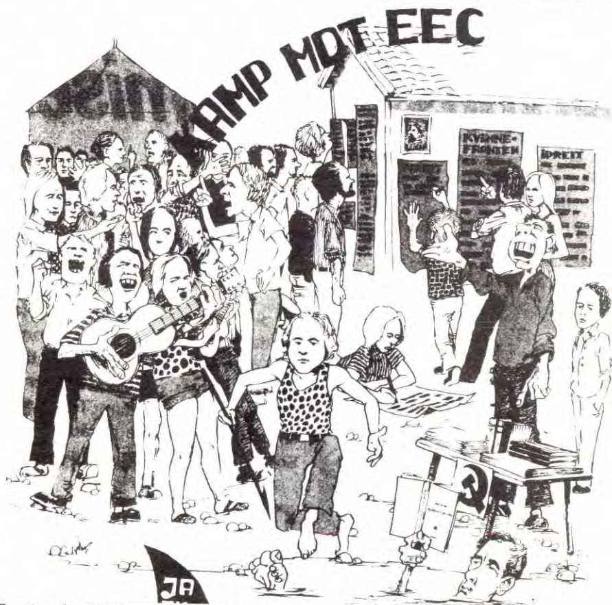
Tegning fra SUF(m-l)s sommerleir. Den fungerte som et lite sosialistisk samfunn for en uke. Snakk med en som var på leieren og hør hvorledes den fungerte.

I et sosialistisk land blir det som regel lagt opp 5-årsplaner for alle områder, produksjonen, utbygginga av landet, jordbruket, skolene, kulturen og kunsten osv. Ett års tid før en slik 5-årsperiode begynner blir det lagt fram et forslag til en slik plan. Denne planen blir da ikke vurdert bare av en gjeng eksperter eller en eller annen komite. Nei, hele folket deltar i diskusjonen av denne planen. Arbeiderne på en fabrikk diskuterer gjennom hele planen,