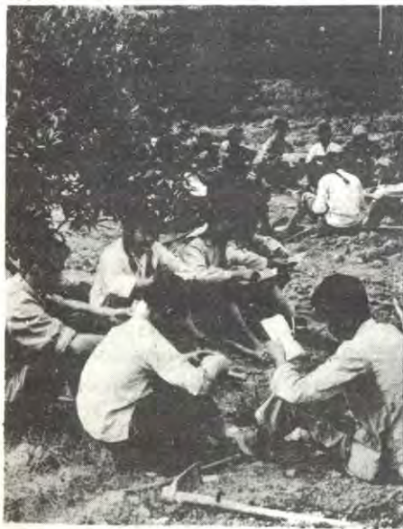
Pause i arbeidet i en appelsinhund.

Hvorfor er det problemer i familien under kapitalismen. Hvorfor krangler foreldre og unger? Hvorfor blir ungdommen beskyldt for å være «vanskelig»? Hvorfor er mødre og fedre dødsslitne etter å ha vært på jobben? Hvorfor blir folk stua sammen i digre drabantbyer? Hvorfor må flere og flere flytte til de store byene? Hvorfor må folk jobbe overtid for å greie utgiftene til hus, mat og klær? I de siste spørsmålene ligger svaret på hvorfor det er problemer i familiene. Å gi folk skikkelige kår, å gi ungdommen skikkelige fritidstilbud, å gi alle anledning til å få den utdannelsen de vil, å la folk få bo der de vil. Disse sakene gir ikke profitt for kapitalistene, de som eier og styrer dette landet. Derfor blir mødre og fedre slitne og nervøse, derfor blir ungdommen forbanna og kanskje «vanskelig» å ha med å gjøre. Men, flere og flere oppdager at det nytter å slåss mot urettferdigheten og