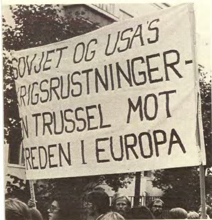
Supermaktene opprustning må føre til krig.

Derfor er det enormt viktig at all anti-imperialistisk ungdom organiserer seg og blir med i kampen mot supermaktene, mot revisjonistenes løgnaktige fredsprat, og at de organiserer seg i den eneste ungdomsorganisasjonen som virkelig forsvarende ungdommens interesser mot begge de to supermaktene, nemlig Rød Ungdom.