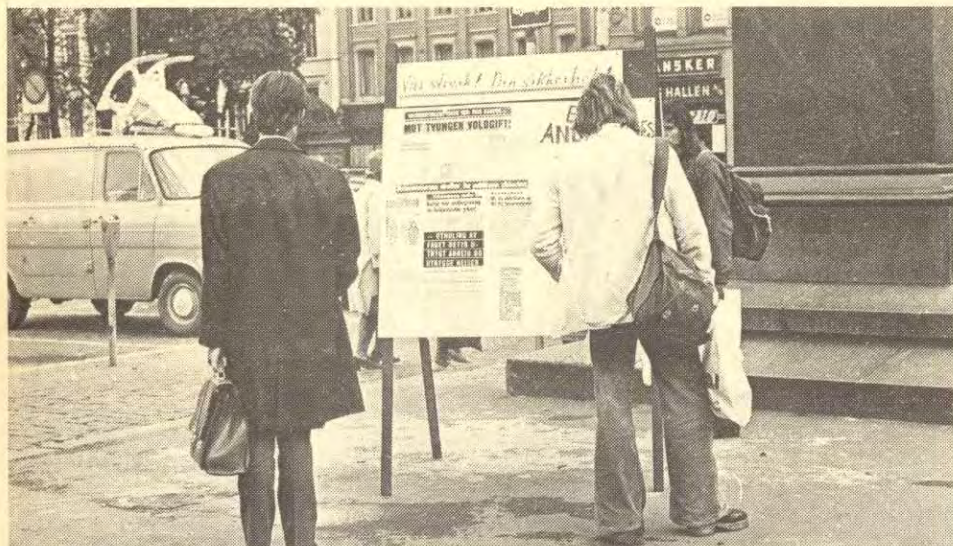
Rød Ungdom har gått i spissen streikestøtteearbeidet blant ungdommen

imperialistiske paroler. Helt siden ml-bevegelsen vokste fram, har vi lagt stor vekt på å gjenreise 1. mai som kampdag. De siste åra har klassekamptoga omfatta titusener av folk, og regjeringstogene til SV og DNA har blitt stilt i skyggen.