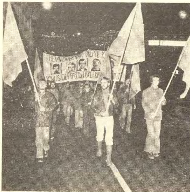
Rød Ungdom har stått i spissen for solidaritetsarbeidet med det spanske folket blant ungdommen.

• I 60-åra hadde AP nesten greid å nedlegge 1. mai som kampdag for arbeiderklassen. Ungene fikk ballonger og brus, og hvis det var demonstrasjoner, så var de prega av classesamarbeid og pro-