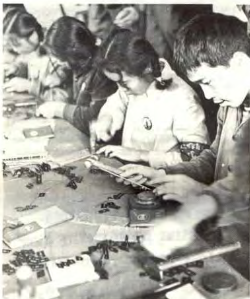
I Kina er utdanning nær knyttet til praktisk arbeid. Her er middelskoleelever fra Tsientsin iferd med å produsere transistorer.

På Tsingua Universitet, en teknisk høyskole i Peking som vi besøkte, hadde motsigelsen vært særlig stor. Rektoren og hans agenter tilrev seg makta på universitetet. Partikomi-