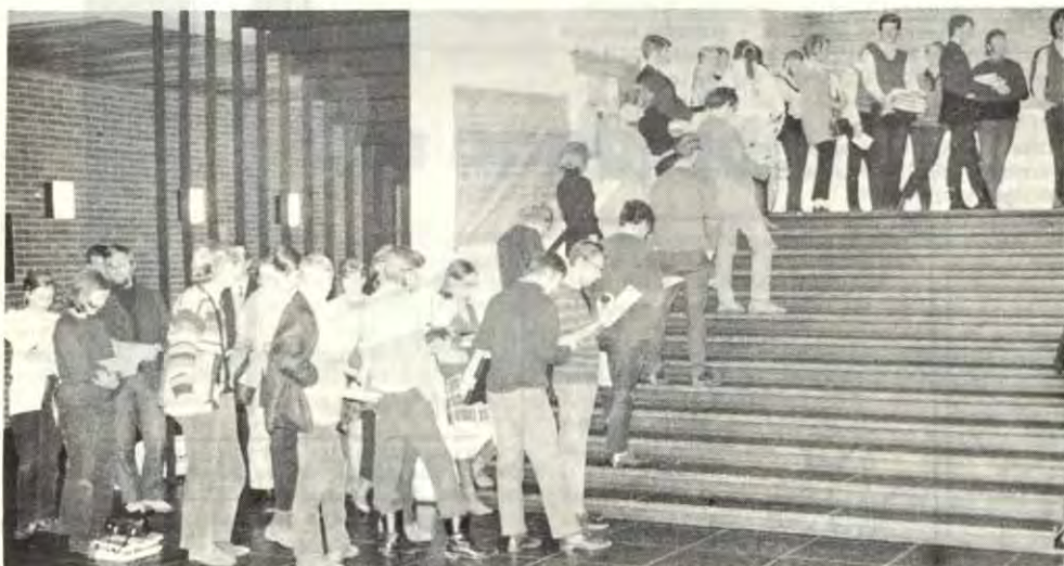
Vanskelige arbeidsforhold på HF - studenter i kø foran lesesalen

Streik på arkitektskolen-krava blir innfridd. Streik på engelsk mot rasjonaliseringsforsøk. Tre-dagers streik på Statens sjukepleierskole mot innføring av pliktår. Streik på minst 8 andre sjukepleierskoler i landet mot pliktåret. Streik på bibliotekskoler og biblioteker mot statens bevilgningspolitikk. Husleiestreiken på studentbyene fortsetter. Ungdom under utdanning til stor demonstrasjon i byen mot statens rasjonaliseringspolitikk den 12. mars.