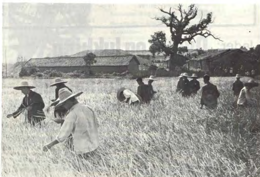
Fra Kiangsi Kommunistiske Arbeideruniversitet hvor arbeidere, bønder og intellektuelle underviser og lærer av hverandre. Her samarbeider de om å finne de beste risaksene til sæd.

Skoleledelsen ble organisert i en "tre-i-en" enhet - med representanter for 1) læ-