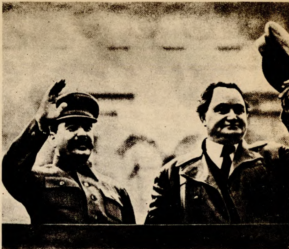
Stalin og Dimitrov

SV-lederne st r i dag ofte for en frontpolitikk som er et slags »vrengbilde» av »venstre»-opportunistenes. SV er en l s, reformistisk valgfront. Det omfatter ulike syn p  s vel strategi som taktikk, – fra venstresosialdemokratisk reformisme til Moskva-revisjonisme og  rlig revolusjon r innstilling. I likhet med »venstre»-folkene vil SV-lederne helst presse sitt partiprogram inn i plattform for enhver front og aksjonsenhet. Men samtidig vil de gjerne utelukke alt som strekker seg ut over ramma av den reformistiske SV-plattformen.