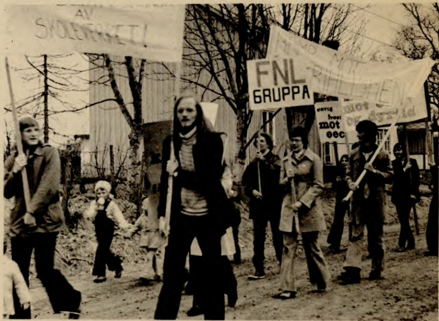
Demonstrasjon i Nesna.