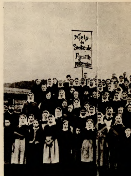
Fyrstikkarbeiderkene i 1889. Den pro av arbeidernes klasseorganisering.

Dette er bakgrunnen for at vi mener at kvinnebevegelsens mest grunnleggende krav i dag, må være »Rett til arbeid».