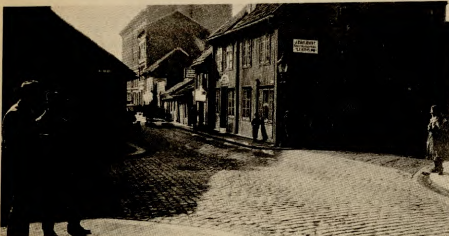
Fra Oslos østkant i 20-årene