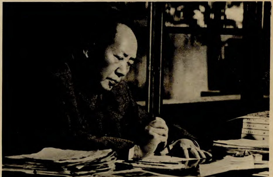
Mao Tsetung. Les: Aktuelle problemer om taktikken i den anti-japanske enhetsfronten.

»Taktikken er å bestemme linjen for hvordan proletariatet skal opptre i de forholdsvis korte perioder med flo eller ebbe i bevegelsen, oppsving eller nedgang i revolusjonen , den er kampen for å gjennomføre denne linjen ved å erstatte de gamle kamp-former og organisasjonsformer med nye, eller ved å kombinere disse former osv.