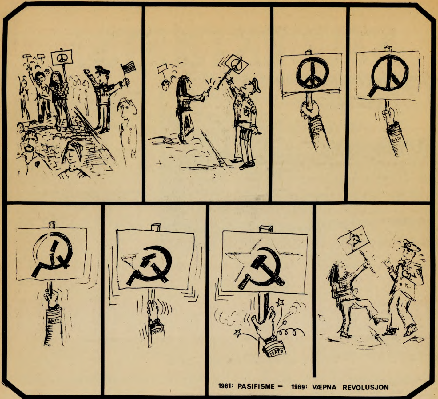
1961: PASIFISME – 1969: VÆPNA REVOLUSJON

forvansket på flere punkter, delvis til og med gjennom sitatforfalskning».