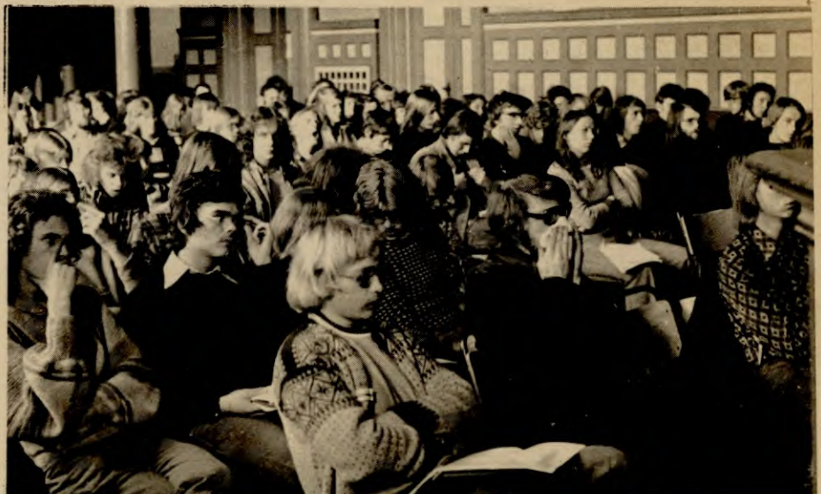
Fra plemundsdebatten på årsmøtet

kulørte ukepressa og hetsinga og nedvurderinga av folket i den reaksjonære borgerpressa.