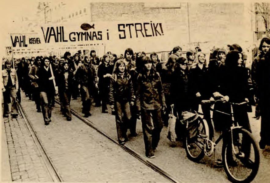
Fra demonstrasjonen i Oslo mot 30-timers uka.

Men tilpassinga til monopolenes behov avspeiles ikke bare i den generelle sparinga som preger denne og andre lovforslag i utdanningsverket. Et prinsipp som preger forslaget er »å lære for å lære». Økt allmennutdanning er en forutsetning for tilegnelse av nytt lærestoff seinere i livet. Folk må forberede seg på å bytte jobb, være i stadig omskolering i takt med de raske og store endringene i »arbeids- og samfunnsliv», som det heter. Da er det