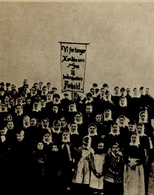
...tære kvinnebevegelsen vokste fram som en del

Oljemeldinga lover mellom 30- og 40tusen nye arbeidsplasser for kvinner. Men dette er bare ca. 6% av alle hjemmевærende kvinner, og bare en dråpe i havet i forhold til alle som ønsker jobb. Dessuten, og det er viktig å merke seg, forbereder den oss på rasering av 1/5 av arbeidsplassene i såkalte »konkurransesatte næringer». Dvs. i sko, bekledning, tekstil, nærings- og nytteindustrien. Det blir angivelig billigere å importere slike produkter. Det er i disse næringene de kvinnelige arbeidsplassene er konsentrert, og de ligger ofte i utkantstrøk. Kvinnene i utkanten vil kanskje få oppleve at det blir enda verre enn før å få jobb når »oljeeventyret» begynner. I alle fall vil parolen »rett til arbeid», være like aktuell som i dag. Se på oljebyen Stavanger: Der averteres stadig etter mannlig arbeidskraft, mens kvinnene står i kø for å få jobb. Jeg vil presisere at dette ikke betyr at kvin-