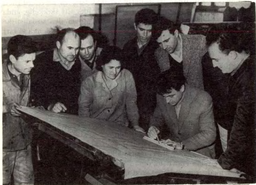
Arbeidere, teknikere og ingeniører ved maskinfabrikken i Stalin Oljesenter utarbeider sammen en plan for å forbedre arbeidet i støperiet.

Det de da gjorde var å få samla arbeiderne på gulvet en dag og få valgt en arbeiderkommisjon av folk de hadde tillit til. Arbeiderkommisjonen gikk ut og kontrollerte ungpionerrepublikken – undersøkte alt, åssen blir maten laga, åssen er forholda ellers. Den kom med kritikk og satte opp en punktvis liste med saker som skulle rettes på. Etter dette var det ikke snakk om noe om og men: kommisjonen skulle komme tilbake i løpet av en tjue dagers tid for å kontrollere at sakene virkelig var retta på.