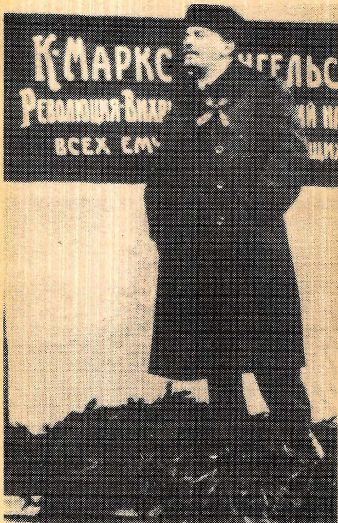
Lenin taler ved avdukinga av minnesmerket over Marx og Engels 7. november 1918.

Derfor er det viktig at du skaffer deg oversikt over åssen Lenin og de andre